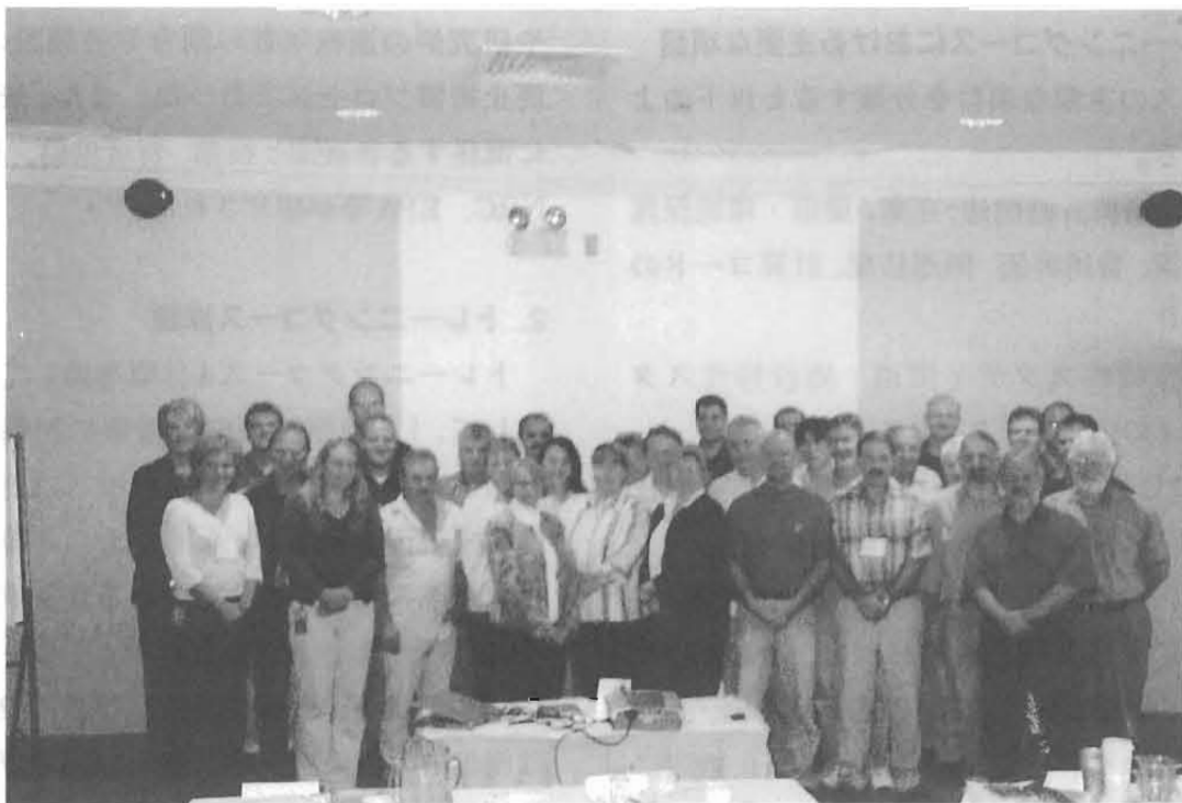
トレーニングコース参加者(会場にて)

また、コースに参加し入手した施設や技術についての数多くの関連資料は、RANDECの廃止措置データベースの情報拡充に、有効に活用できると考えられる。