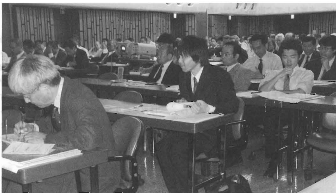
報告と講演の会 開催風景

当日は、例年同様多数の皆様のご参加をいただきました。行き届かぬ点多々あったことと存じます。ここにあらためて厚くお礼申し上げます。